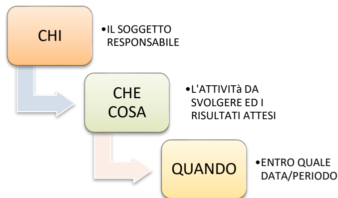
TAB. - MODELLO DI INDIVIDUAZIONE DELLE RESPONSABILITA'

Le procedure sono elaborate a partire dall'analisi dell' as is (stato dell'arte in azienda) e tenendo conto delle risultanze della mappatura dei rischi.